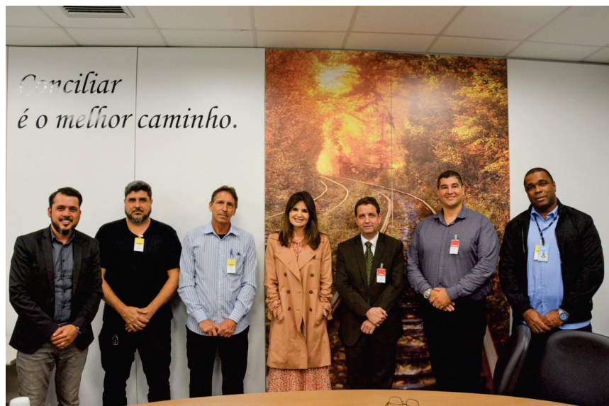
Diretores do Senalba ES e do Sesc na mesa de negociação mediada pelo TRT

SINDICATO GARANTE TICKET ALIMENTAÇÃO DE FÉRIAS E REAJUSTE DE 25% NO BENEFÍCIO