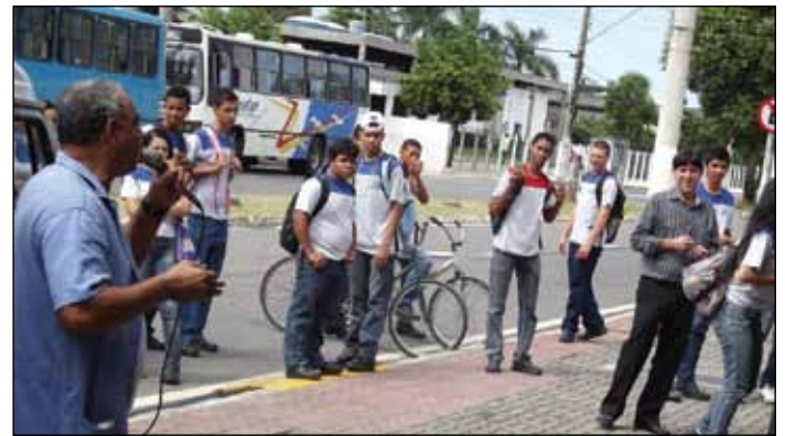
Gerente da unidade Civit observa sindicalista discursando

O Senai nesse mês de abril completou 60 anos de atividades. O Senalba marcou presença para “comemorar” o aniversário de uma instituição parada no tempo, que não evoluiu em tecnologia e está sucateada. Houve distribuição de bolo e protesto em frente ao Senai Civit no dia 05.