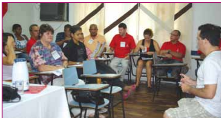
Curso de formação para a diretoria e trabalhadores no Senalba

Diretores e funcionários do Senalba participaram de um curso de formação sobre Negociação Coletiva e Campanha Salarial. Realizado no Calir, durante dois dias, o